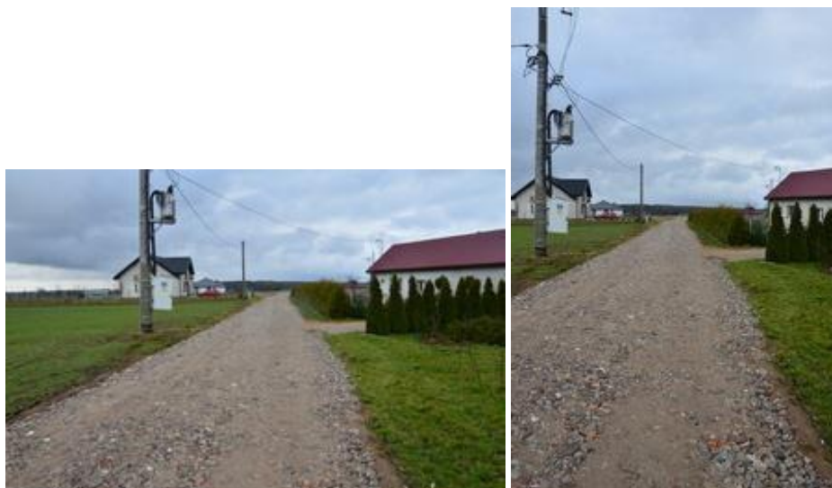
Widok po realizacji inwestycji.