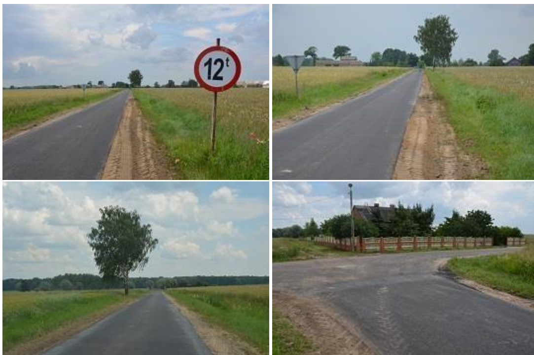
Widok po realizacji inwestycji.