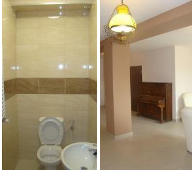
Widok po realizacji inwestycji.