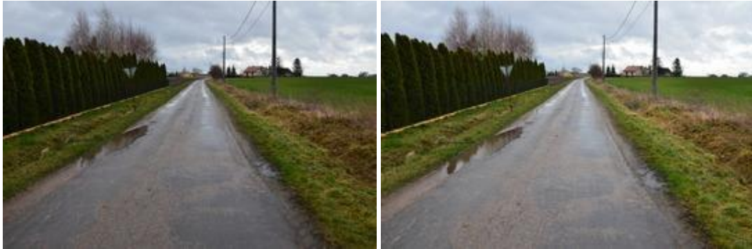
Widok przed realizacją inwestycji.