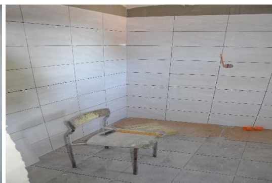
Widok podczas realizacji inwestycji