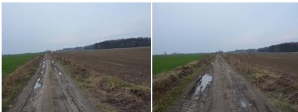
Widok przed realizacją inwestycji.