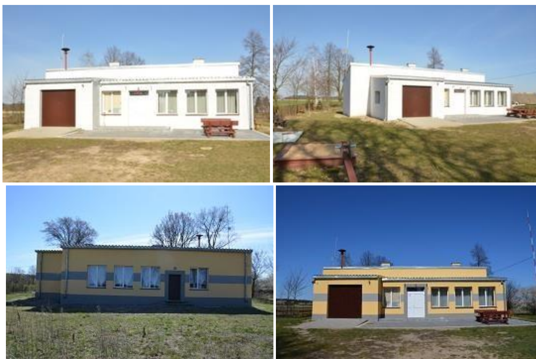
Widok po realizacji inwestycji.