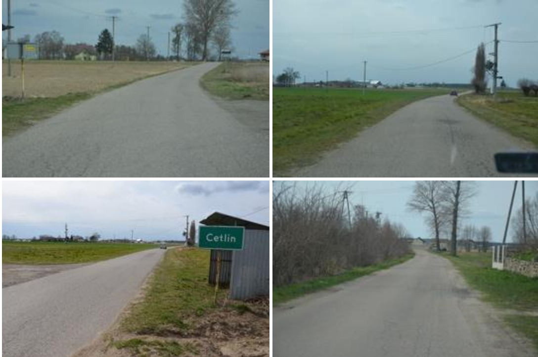
Widok przed rozpoczęciem realizacji inwestycji.