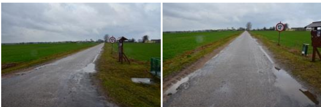
Widok przed realizacją inwestycji.