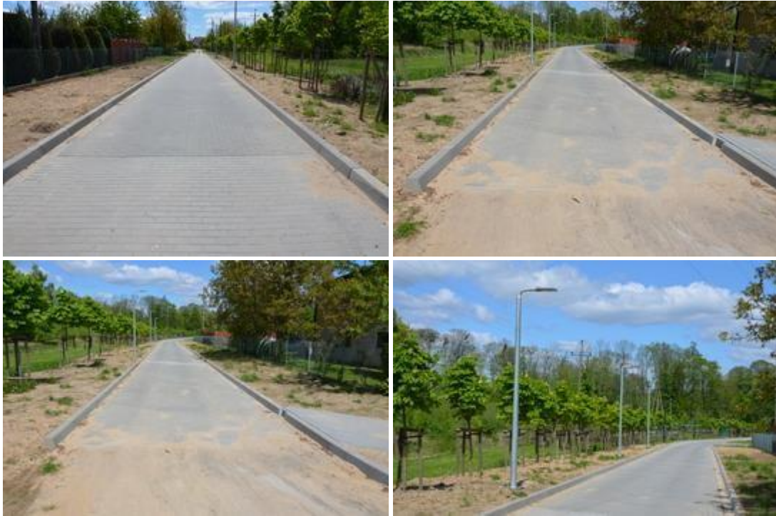
Widok po realizacji inwestycji