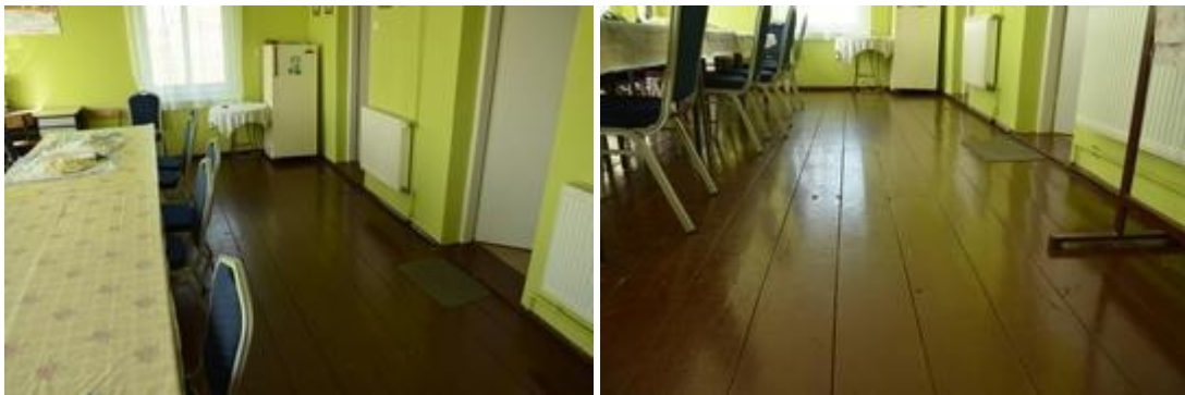
Widok przed rozpoczęciem realizacji inwestycji.