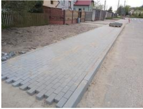
Widok podczas realizacji inwestycji.