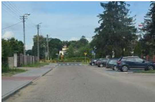
Widok po realizacji inwestycji.