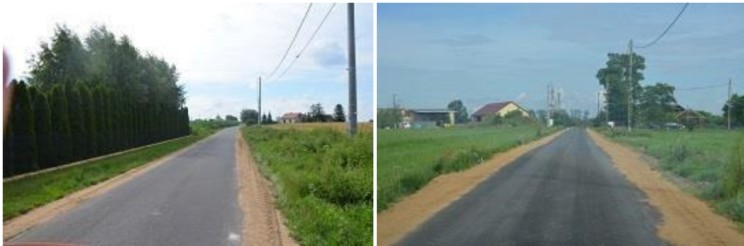
Widok po realizacji inwestycji.