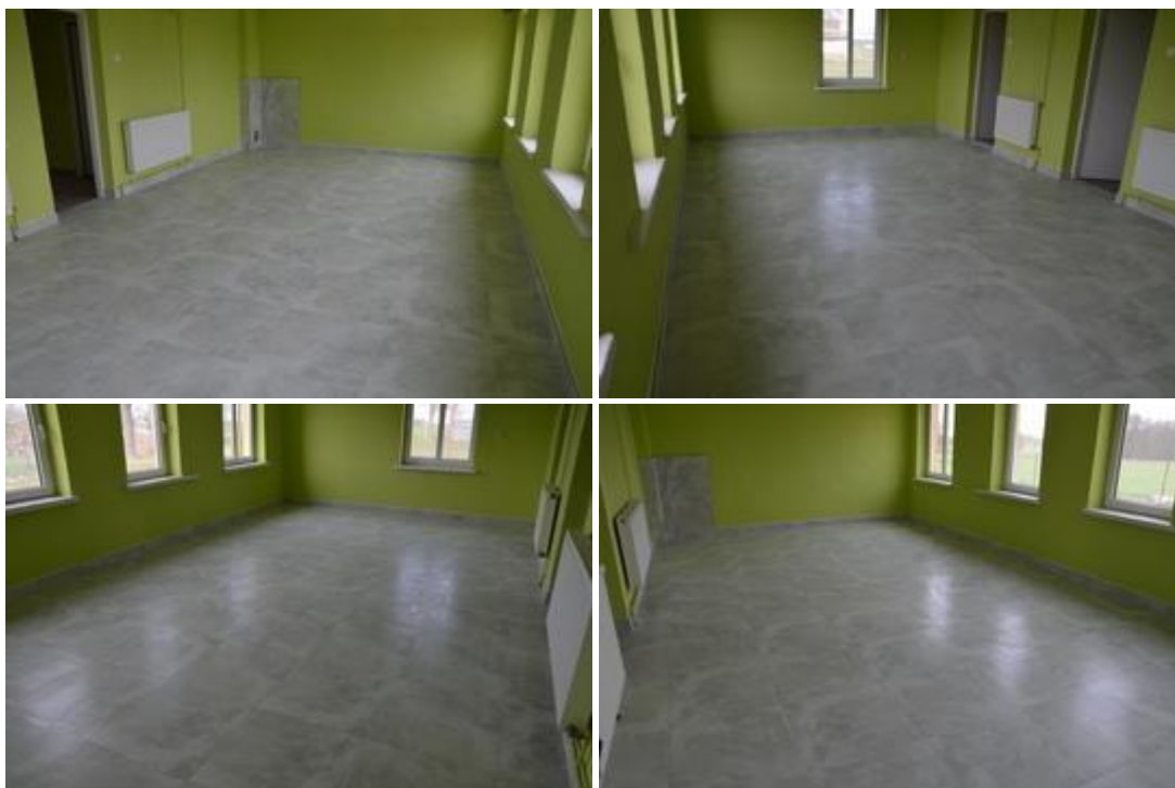
Widok po zakończeniu realizacji inwestycji.