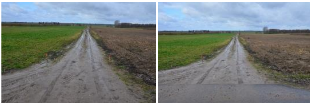
Widok przed realizacją inwestycji.