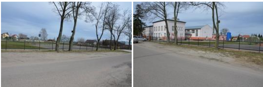
Widok przed rozpoczęciem realizacji inwestycji.