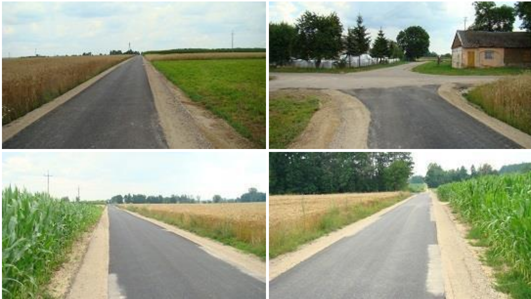
Widok po realizacji inwestycji