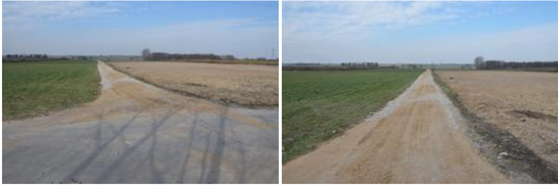
Widok po realizacji inwestycji.