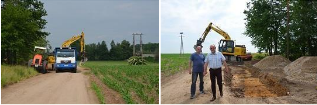
Widok podczas realizacji inwestycji.