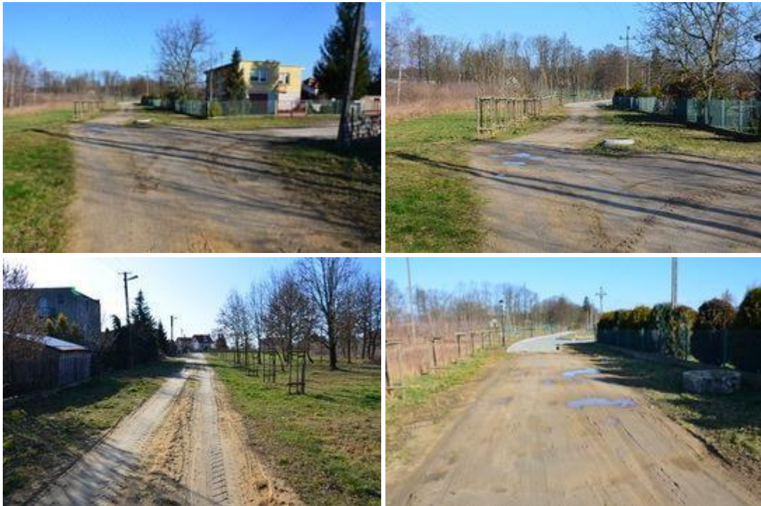
Widok przed realizacją inwestycji.