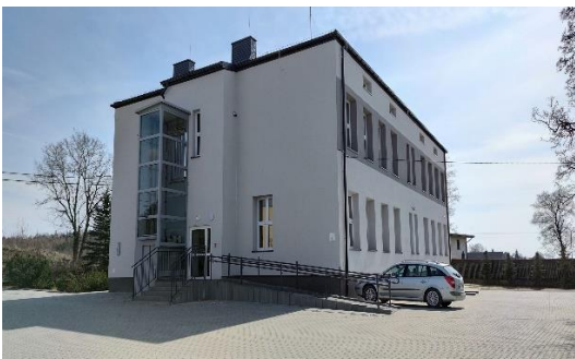
Widok po realizacji