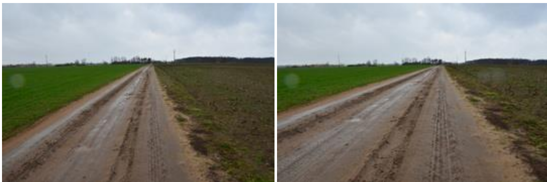
Widok przed realizacją inwestycji.