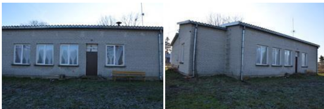
Widok przed realizacją inwestycji.