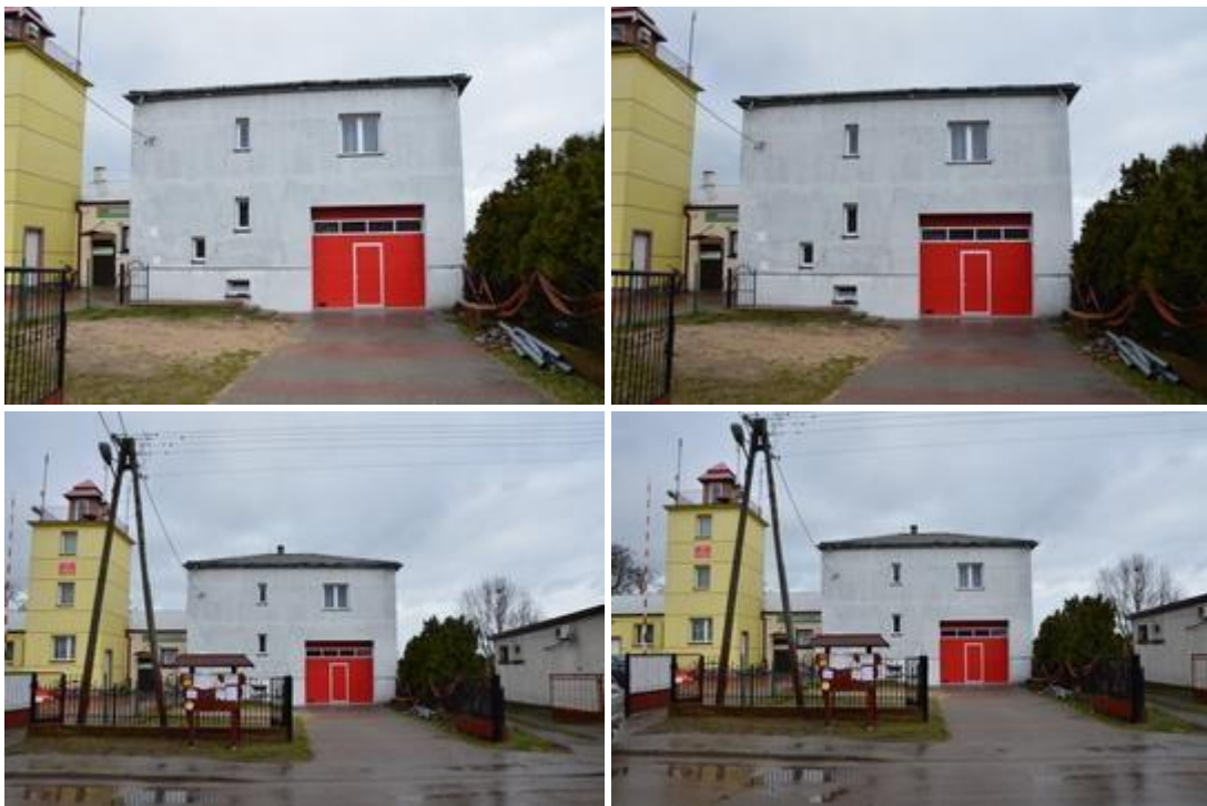
Widok po realizacji inwestycji.

Przebudowa budynku OSP w miejscowości Lelice - prace termomodernizacyjne i remont dachu.