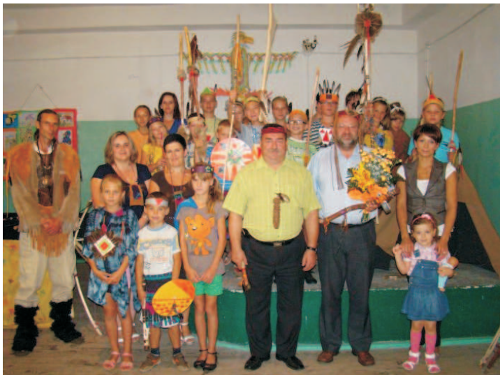
Zakończenie pracy świetlicy w Rempnie