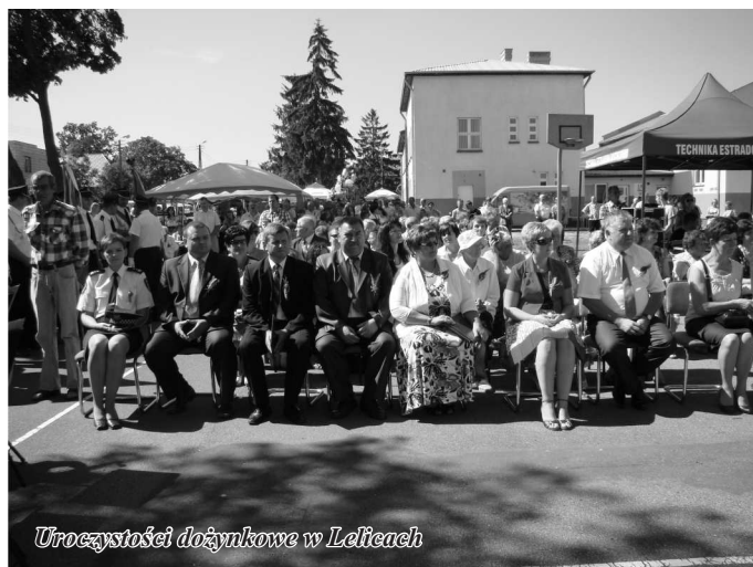
Uroczystości dożynkowe w Laltech

Obecnie święto to stanowi połączenie tradycji i religii oraz