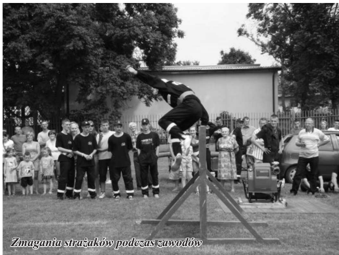
Zmagania strażaków podczas zawodów

Po długich przygotowaniach i treningach nadszedł czas sportowych zmagani. Druhowie rozpoczęli zawody w upalne sobotnie popołudnie od utworzenia strażackich szyków i zapoznania się z zasadami rywalizacji. Strażacy wystartowali w dwóch konkurencjach. Pierwsza to sztafeta z przeszkodami 7x50, a druga to ćwiczenie bojowe polegające na rozwinięciu linii głównej tworzonej przez dwa odcinki węża do rozdzielacza oraz od rozdzielacza do linii gaśniczych, składających się z dwóch odcinków zakończonych prądownicą. Strażacy musieli strumieniem wody trafić w tarcze i strącić pacholki. Konkurencjom towarzyszyło wiele wrażeń a licznie przybyła publiczność zagrzewała zawodników do zaciętej rywalizacji.