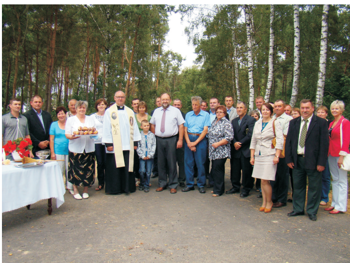
Uroczyste otwarcie drogi w Golejewie