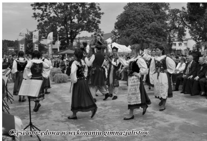
Część obrzędowa w wykonaniu gimnazjalistów

W trakcie programu odbyła się ceremonia wręczenia wieńca i chleba przez młodzież oraz starostów uroczystości Wójtowi Gminy Gozdowo i Staroście Sierpeckiemu. Gospodarze dożynek, starym zwyczajem, dokonali symbolicznego gestu - dzielenia się chlebem, owocem pracy