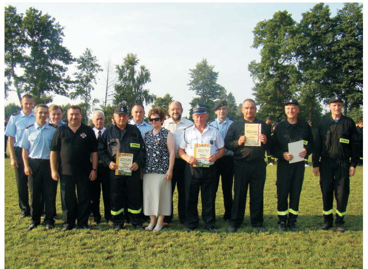
Zawody szkoleniowo-pożarnicze w Ostrowach