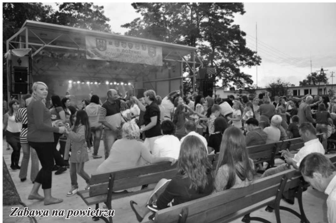
Zabawa na powietrzu