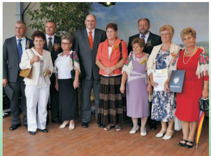
Dożynki Powiatowo-Gminne w Gozdowie