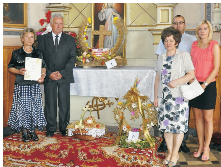
Uroczystości dożynkowe w Kurowie