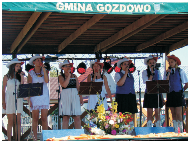
Uroczystości dożynkowe w Lelicach