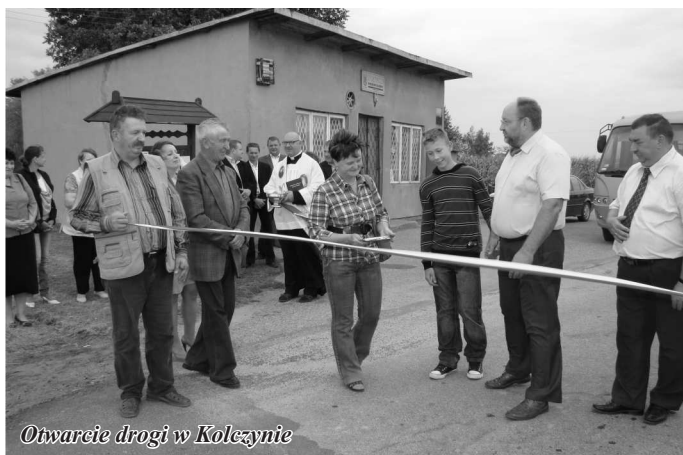
Otwarcie drogi w Koleczynie

W trakcie przeglądu pan Wójt zwrócił uwagę na mniejsze inwestycje, które znalazły się na trasie przejazdu, tj. naprawioną drogę powiatową w m. Białuty, przebudowanie drogi gminnej w kierunku Bronoszewic i w m. Rempin. Omówił w skrócie zakres przebudowywanej drogi powiatowej Gozdowo-Piaski na odcinku od ul. Sosnowej do skwerku w centrum Gozdowa wraz z remontem chodnika i budową zatoczki autobusowej. Zadanie jest w trakcie realizacji na zasadzie współfinansowania z powiatem sierpeckim.