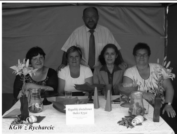
KGW z Rycharcic