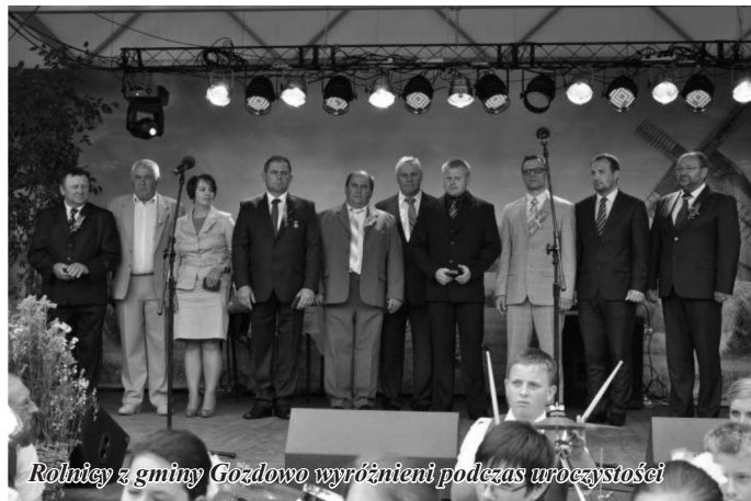
Rolnicy z gminy Gozdowo wyróżnieni podczas uroczystości

Powiatowe uroczystości dożynkowe były okazją do przedstawienia wyników konkursu organizowanego przez KRUS w Sierpcu „Bezpiecznie na wsi - czy upadek do przypadek?”.