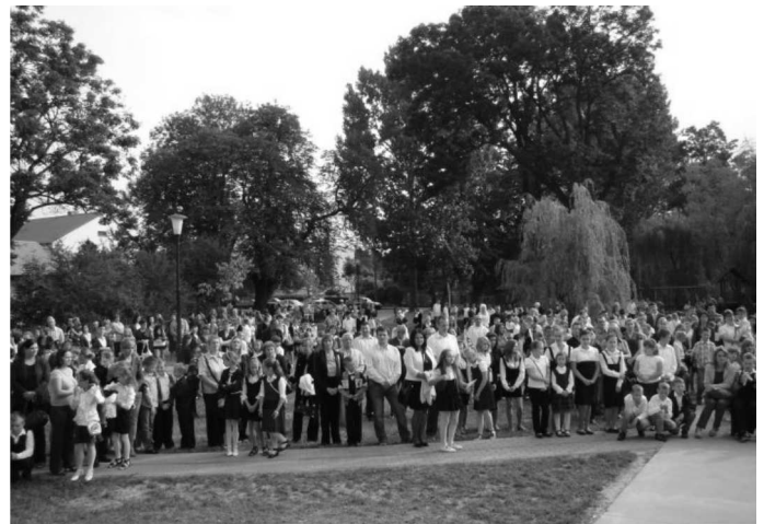
Uroczyste rozpoczęcie nowego roku szkolnego

252, SPLelice - 126, SPOstrowy - 70, Gimnazjum - 233 uczniów a do Publicznego Przedszkola w Gozdowie uczęszcza 105 dzieci.