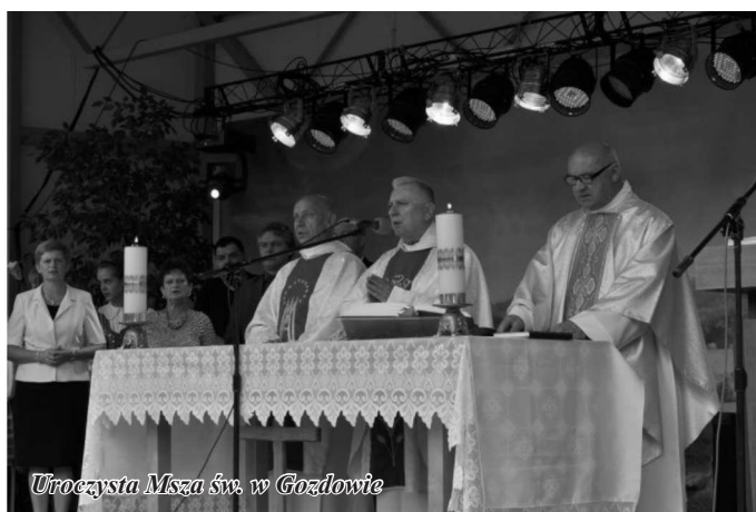
Uroczysta Msza św. w Gozdowie

Symbolicznym momentem Eucharystii było poświęcenie plonów zebranych z pól - chleba i pięknych dożynkowych wieńców splatanych z pszenicy, żyta, jęczmienia, owsa i udekorowanych kwiatami i wstążkami.