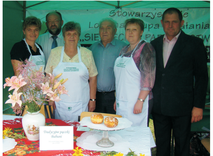
Koło Gospodyń z Golejewa na wystawie w Sierpcu