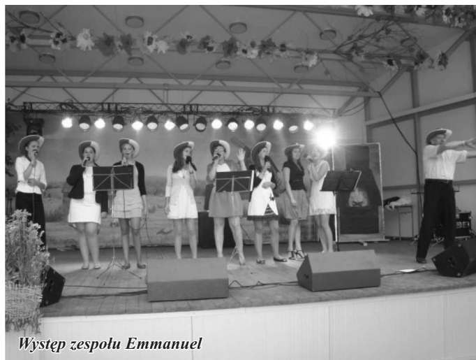
Występ zespołu Emmanuel

Dożynki to święto chleba i tych, którzy go współtworzą: Boga i ludzi. Ale to również promowanie i ocalanie od zapomnienia tradycji związanej z muzyką i śpiewem ludowym, podtrzymywanie pięknych polskich zwyczajów, które rozweselają i łączą ze sobą ludzi.