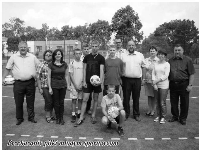
Przekazanie piłki młodym sportowcom

Obiekt sportowy powstał w ramach realizacji projektu pn. „Rozwój obszarów o szczególnym znaczeniu dla zaspokajania potrzeb mieszkańców miejscowości Gozdowo