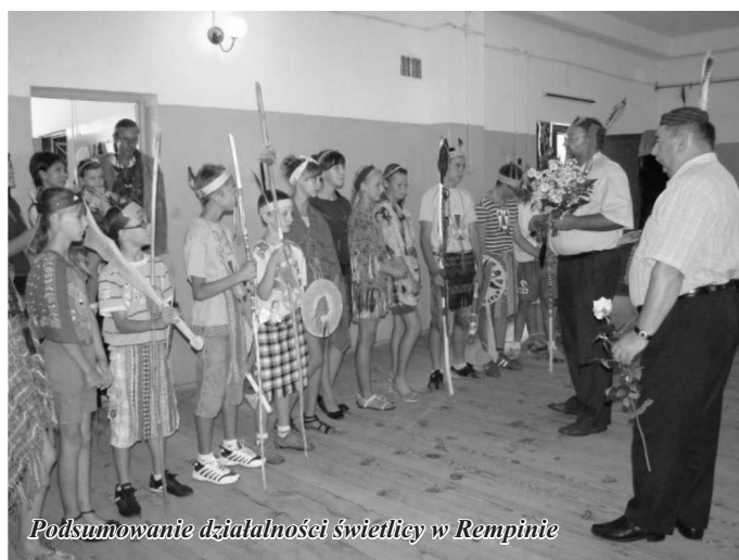
Podsumowanie działalności świetlicy w Rempinie

Zakończenie przebiegło w miłej i serdecznej atmosferze a po części oficjalnej dzieci wesoło bawiły się podczas dyskoteki.