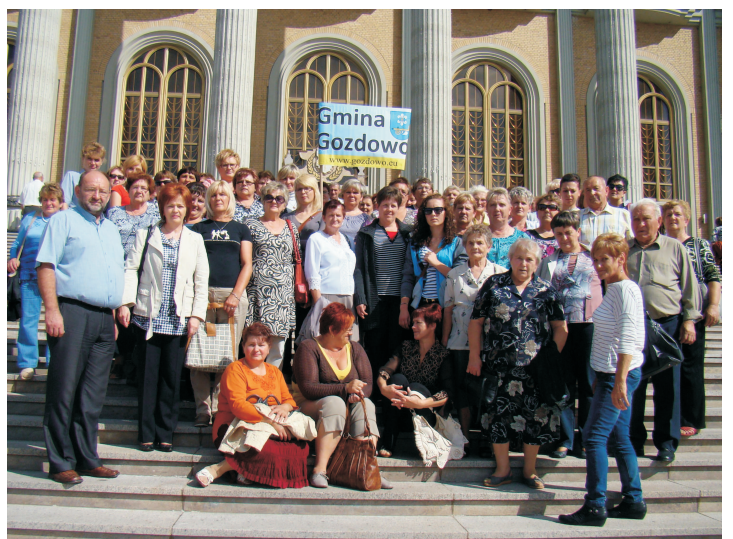
II Ogólnopolski Zjazd Kół Gospodyń Wiejskich w Licheniu