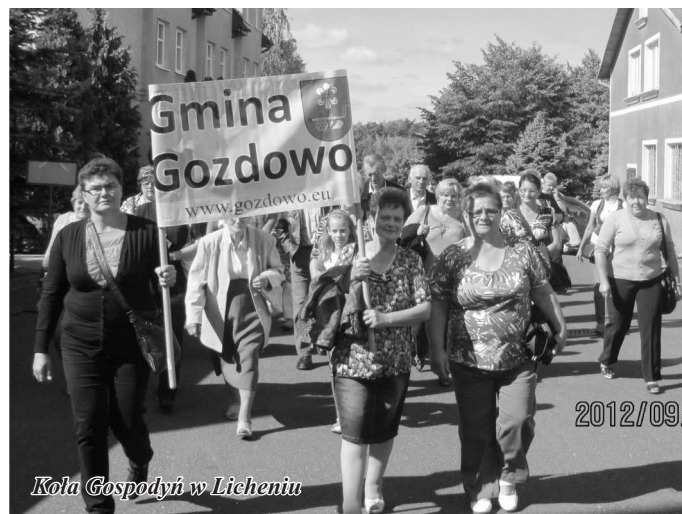
Koła Gospodyń w Licheniu