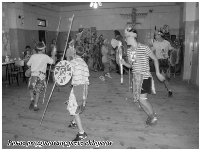
Pokaz przygotowany przez chłopców

Po występach wychowanków świetlicy p. Wójt serdecznie wszystkim podziękował a w szczególności dzieciom oraz