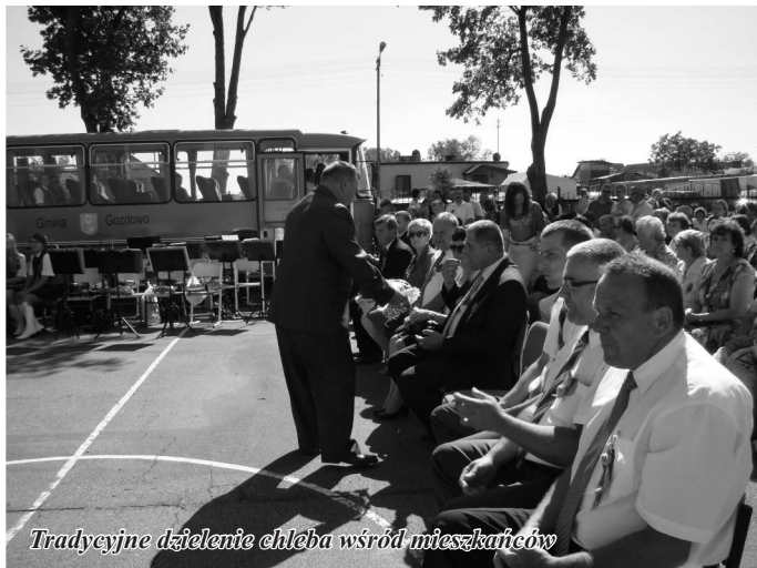
Tradycyjne dzielenie chleba wśród mieszkańców

zabawy. To przede wszystkim dziękczynienie Bogu za dar plonów zbieranych latem na polach i łąkach. W tym roku nasza gmina została wybrana gospodarzem dożynek powiatowych.