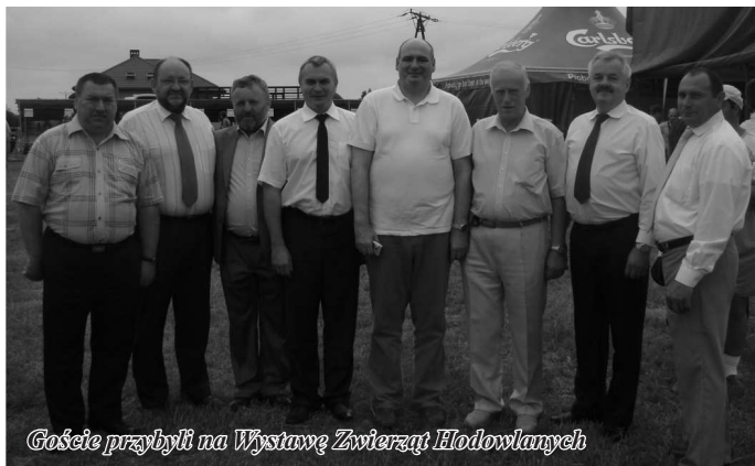
Goście przybyli na Wystawę Zwierząt Hodowlanych

Na IX Regionalną Wystawę Zwierząt Hodowlanych w Sierpcu przybyło dwudziestu ośmiu wyróżniających się