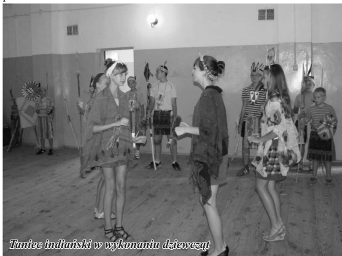
Taniec indiański w wykonaniu dziewcząt