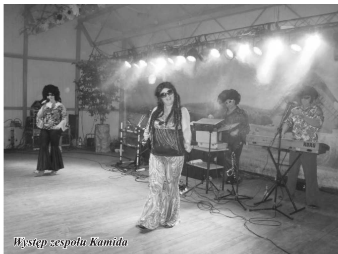
Występ zespołu Kamida

Zaangażowanie, doświadczenie i kreatywność wielu osób przyczyniły się do tego, że ludowe święto plonów stało się wspaniałą okazją nie tylko do udanej zabawy, ale także do promocji naszej gminy w powiecie i województwie.