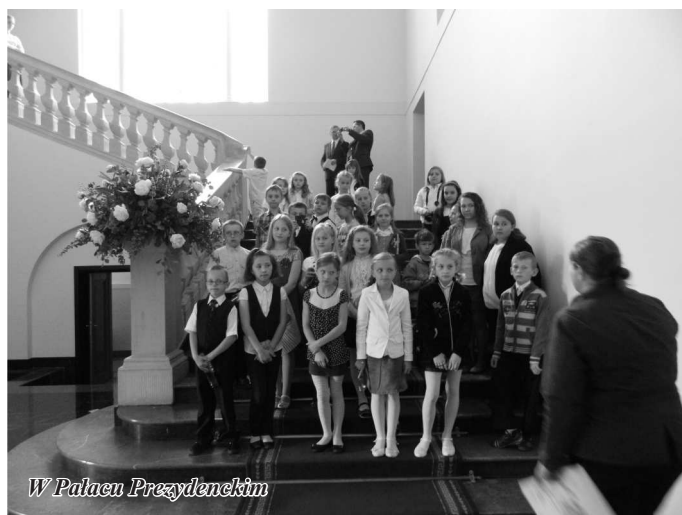
W Pałacu Prezydenckim