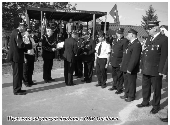
Wręczenie odznaczeń druhom z OSP Gozdowo