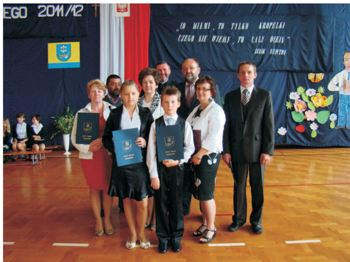
Najlepsi uczniowie ze Szkoły Podstawowej w Ostrowach