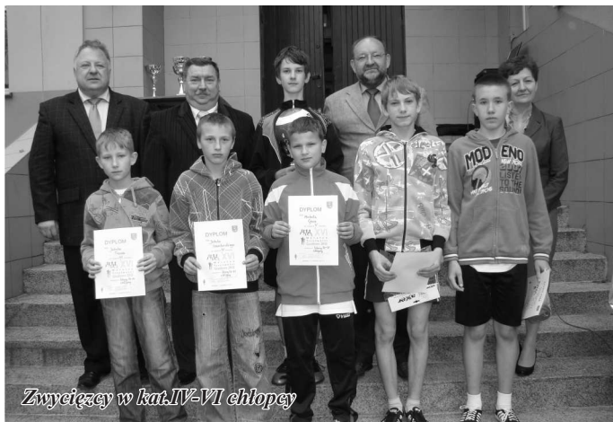
Zwycięzcy w kat. IV-VI chłopcy