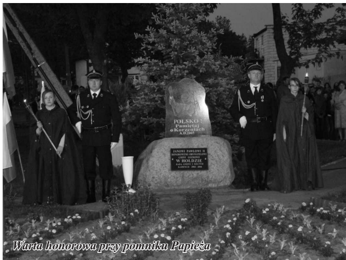
Warta honorowa przy pomniku Papieża