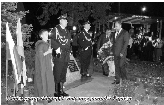
Władze gminy składają kwiaty przy pomniku Papieża