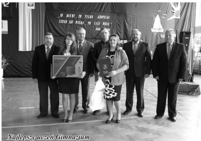
Najlepszy uczeń Gimnazjum