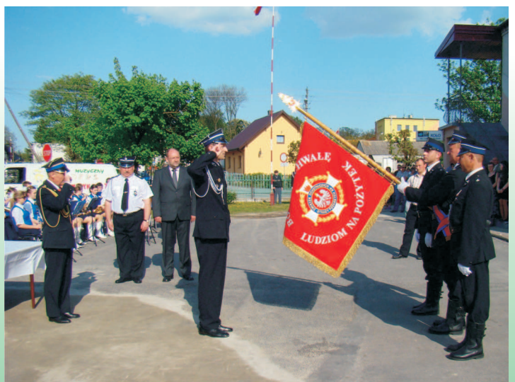
100-lecie OSP w Gozdowie

„Słowo Gozdowa” - biuletyn informacyjny Wójta i Rady Gminy Gozdowo, Zespół redakcyjny w składzie: Ewa Kolankiewicz, Aurelia Kurach, Maria Pytelewska, Mariola Kopka, Monika Gronczewska, Dariusz Kalkowski. Zespół zastrzega sobie prawo dokonywania zmian w treści publikowanych artykułów. Wydawca: Urząd Gminy w Gozdowie, ul. Krystyna Gozdawy 19, 09-213 Gozdowo