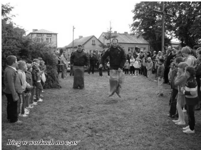
Bieg w workach na czas