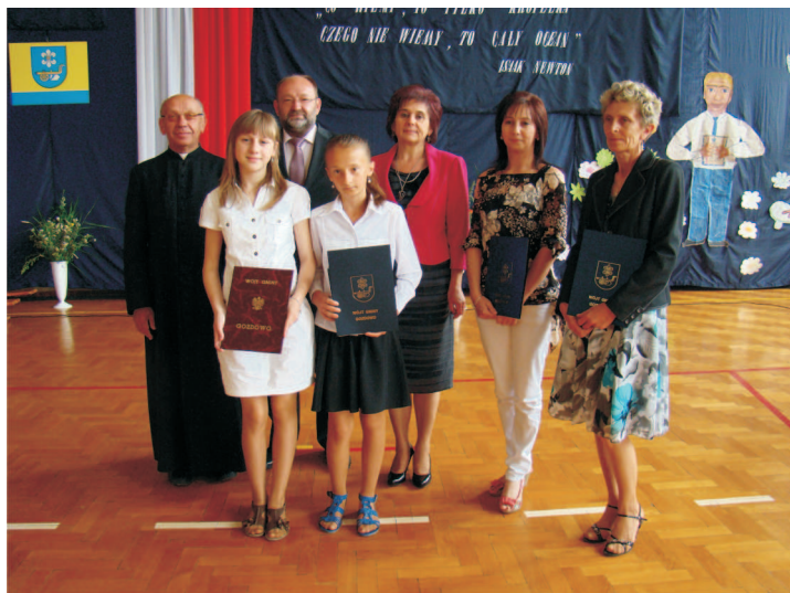
Najlepsi uczniowie ze Szkoły Podstawowej w Lelichy