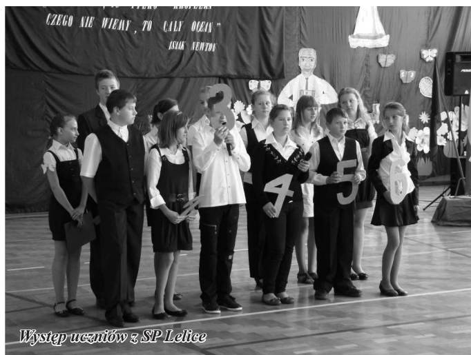
Występ uczniów z SP Lelice