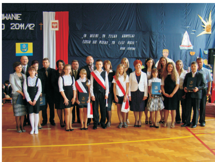
Najlepsi uczniowie ze Szkoły Podstawowej w Gozdowie