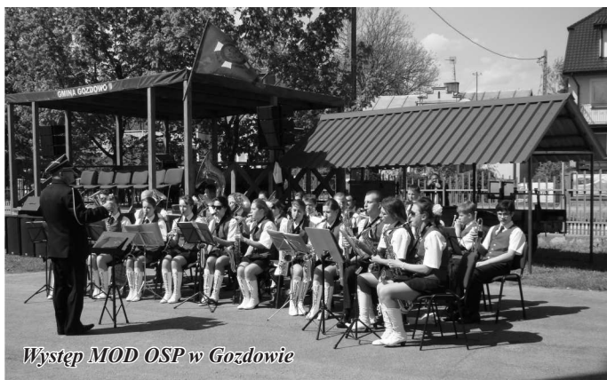
Występ MOD OSP w Gozdowie

podziękowania i listy gratulacyjne. Następnie został odczytany i podpisany przez wszystkich zebranych Akt Jubileuszowy przygotowany na okoliczność setnej rocznicy powstania OSP w Gozdowie. Na zakończenie odbyła się defilada paradna.