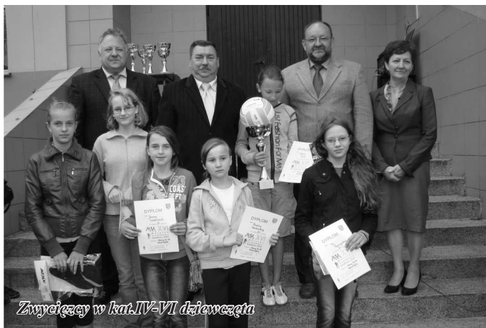
Zwycięzcy w kat. IV-VI dziewczęta