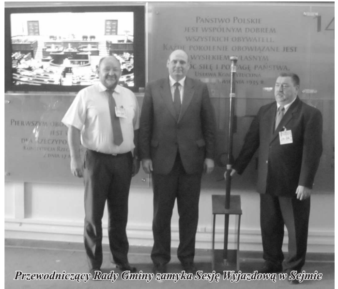
Przewodniczący Rady Gminy zamyka Sesję Wyjazdową w Sejmie