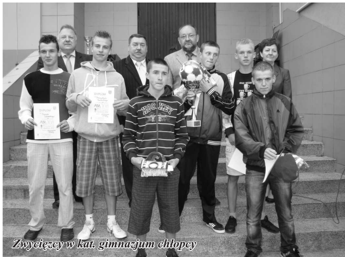
Zwycięzcy w kat. gimnazjum chłopcy