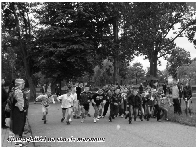
Gimnazjaliści na starcie maratonu