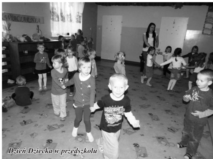
Dzień Dziecka w przedszkolu

zdrowy poczęstunek w formie owoców, a na zakończenie Przedszkolaki otrzymały wspaniałe prezenty. To był wyjątkowy dzień dla naszych pociech.