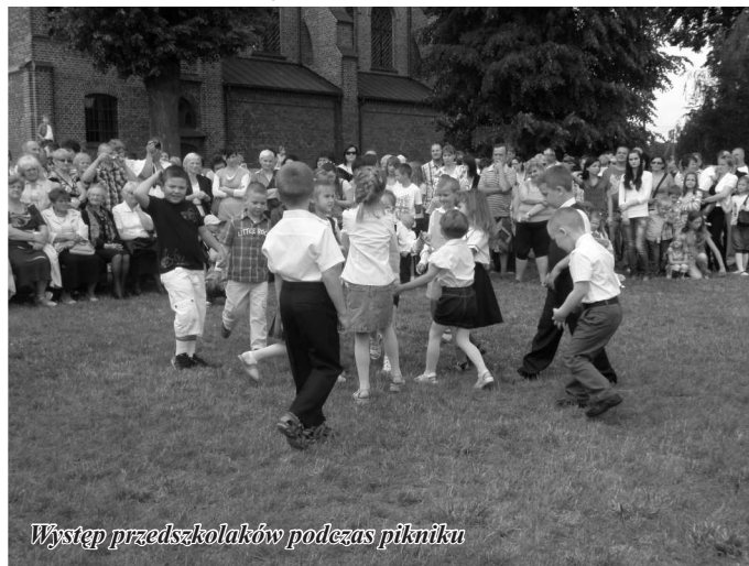
Występ przedszkolaków podczas pikniku

Dnia 17 czerwca 2012r. na placu koło Kościoła p.w. Wszystkich Świętych w Gozdowie odbył się po raz pierwszy „Piknik Rodzinny” zorganizowany przez Księżę. Z tej okazji Nasze Przedszkolaki oraz grupy „0” wraz ze swoimi opiekunami przygotowały barwny pokaz artystyczny. Przedszkolaki rozpoczęły występ od przepięknych piosenek i wierszy z okazji Dnia Mamy i Taty, a pokaz zakończyły barwne tańce grup „0”. Wszystkie występy zostały nagrodzone gromkimi brawami.