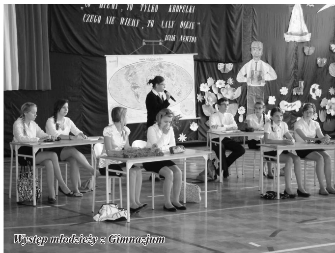
Występ młodzieży z Gimnazjum

W dalszej części wystąpienia Wójt Gminy podkreślił, że jednym z elementów aktualnej polityki oświatowej państwa jest wprowadzenie nowej podstawy programowej kształcenia ogólnego oraz obniżenie wieku szkolnego. Zmiany te nie byłyby możliwe bez współpracy i jednakowych działań nauczycieli, organu prowadzącego oraz Ministerstwa