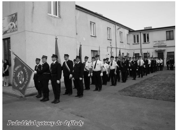
Pododdział gotowy do defilady

Kolejnym punktem uroczystości była podniesienie ceremonii pożegnania starego sztandaru oraz poświęcenia i wręczenia nowego, ufundowanego przez Samorząd gminy Gozdowo. Nowy sztandar został udekorowany przyznanym jednostce Złotym Znakiem Związku OSP RP i poczet sztandarowy dokonał jego prezentacji przed frontem przybyłych delegacji OSP z sąsiednich miejscowości oraz zaproszonych gości.