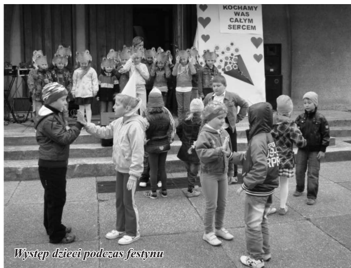
Występ dzieci podczas festynu