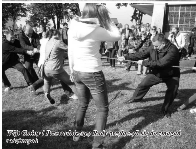
Wójt Gminy i Przewodniczący Rady przyłączyli się do zmagania rodzinnego