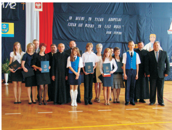
Najlepsi uczniowie z Publicznego Gimnazjum w Gozdowie