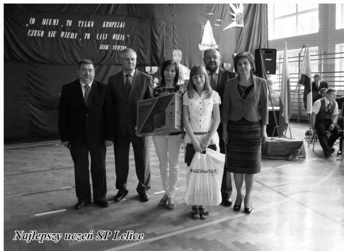
Najlepszy uczeń SP Lelice