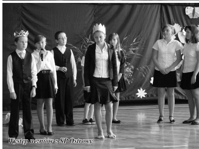
Występ uczniów z SP Ostrowy

Edukacji a przede wszystkim bez dodatkowych środków finansowych. W tym celu nasza gmina realizuje różne programy i projekty pozyskując środki finansowe na doposażenie szkół w pomoce dydaktyczne oraz rozszerzenie oferty edukacyjnej wynikającej z potrzeb uczniów: