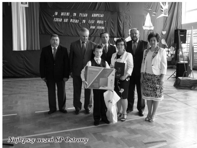
Najlepszy uczeń SP Ostrowy

Kolejnym punktem programu uroczystości były prezentacje uczniów szkół z terenu naszej gminy, które wprowadziły wszystkich zebranych w letni i słoneczny czas wakacji a także koncert MOD OSP w Gozdowie, który był prawdziwą ucztą muzyczną dla uszu i serc obecnych.