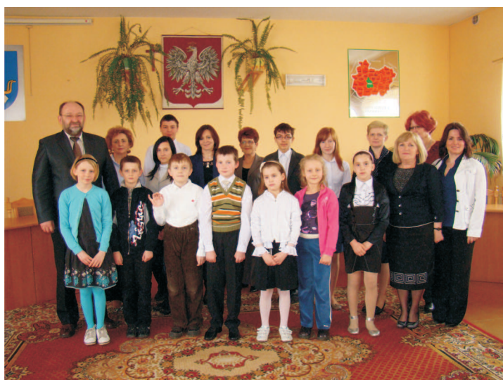
Uczniowie nagrodzeni w Konkursie Plastycznym