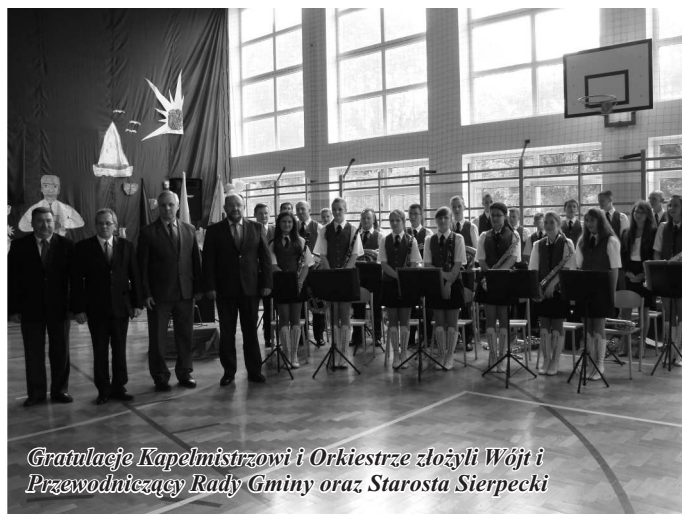
Gratulacje Kapelmistrzowi i Orkiestrze złożyli Wójt i Przewodniczący Rady Gminy oraz Starosta Sierpecki