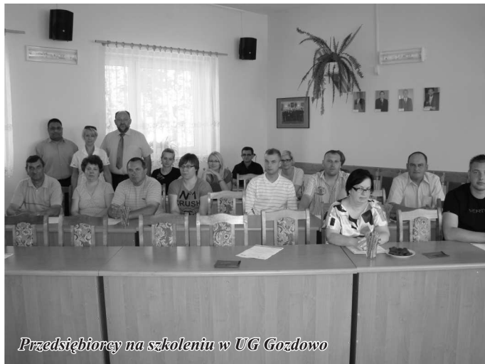
Przedsiębiorcy na szkoleniu w UG Gozdowo