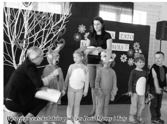
Występ przedszkolaków podczas Dnia Mamy i Taty

zaprezentować się jak najlepiej. Po części artystycznej nastąpiło wręczenie przez dzieci prezentów dla rodziców, a następnie wszyscy zostali zaproszeni do wspólnego obejrzenia prezentacji, w której głównymi bohaterami były przedszkolaki. Rodzice nie kryli wzruszenia i łez. Atmosferę rozluźniło pyszne ciasto na zakończenie uroczystości.