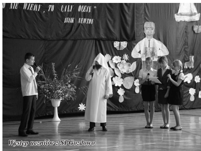
Występ uczniów z SP Gozdowo