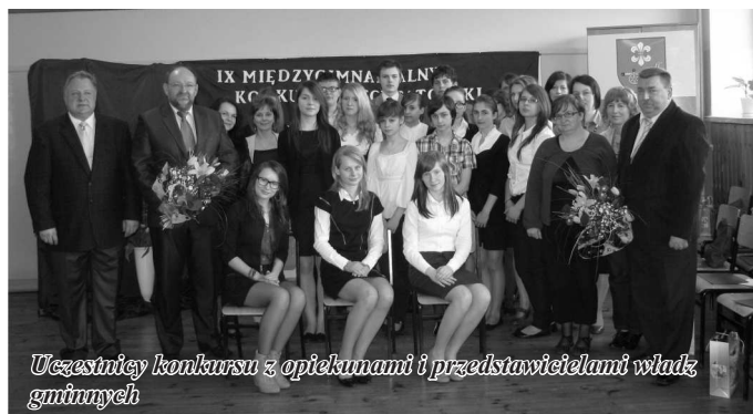
Uczestnicy konkursu z opiekunami i przedstawicielami władz gminnych