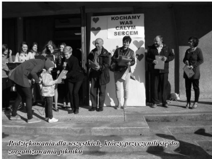
Podziękowania dla wszystkich, którzy przyczynili się do zorganizowania pikniku