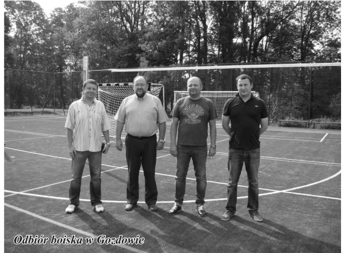
Odbiór boiska w Gozdowie