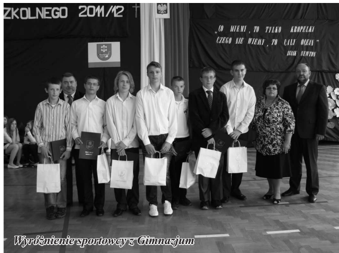
Wyróżnienie sportowcy z Gimnazjum

Uroczystość była również okazją do ogłoszenia wyników w VIII edycji KONKURSU – ZBIÓRKA MAKULATURY zorganizowanego przez Samorząd Województwa Mazowieckiego na szczeblu gminy. W tym roku zwyciężyła Szkoła Podstawowa im. Marii Konopnickiej W Gozdowie, której uczniowie zebrali 4.500 kg, co stanowi w przeliczeniu na ucznia 18,75 kg – placówka otrzymała telewizor LCD „42”.