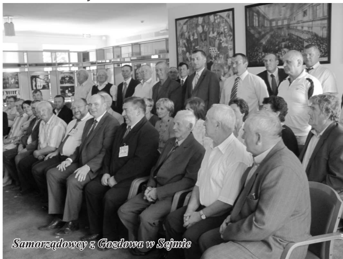
Samorządowcy z Gozdowa w Sejmie

W trakcie realizacji porządku obrad radni podjęli m.in. uchwały w sprawach: uchwalenia statutu GOPS w Gozdowie, wprowadzenia zmian w statucie SPZOZ w Gozdowie, nadania nazw ulicom w Rempinie, powołania komisji regulaminowej do opiniowania wniosków o przyznanie odznaczenia pamiątkowego „Zasłużony dla Gminy Gozdowo”, ustalenia szczegółowych zasad udzielania rozmiaru zniżek nauczycielom, którym powierzono stanowiska kierownicze w szkołach i przedszkolach oraz szczegółowe zasady zwalniania od obowiązku realizacji tygodniowego obowiązkowego wymiaru godzin zajęć, zasady rozliczania tygodniowego obowiązkowego wymiaru godzin zajęć nauczycieli, dla których ustalony plan zajęć jest różny w poszczególnych okresach roku szkolnego, tygodniowy obowiązkowy wymiar godzin zajęć nauczycieli szkół niewymienionych w art. 42 ust. 3 Karty Nauczyciela oraz dla nauczycieli realizujących w ramach stosunku pracy obowiązki określone o różnym tygodniowym wymiarze godzin, w sprawie zmiany Wieloletniej Prognozy Finansowej Gminy Gozdowo na lata 2012-2020 oraz w sprawie zmian w budżecie Gminy Gozdowo w 2012 roku.