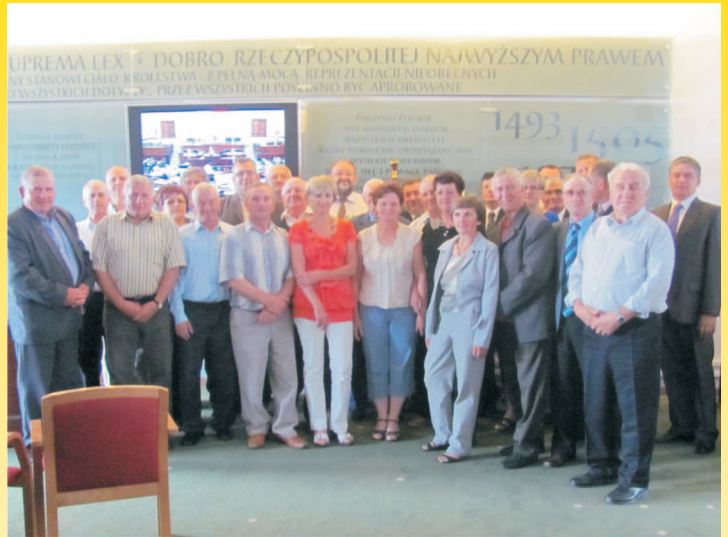
Wyjazd Samorządowców do Sejmu