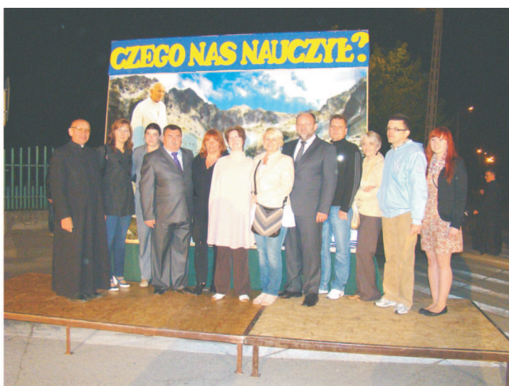
VIII Gminne Zamyślenia w hołdzie Ojcu Świętemu – Janowi Pawłowi II