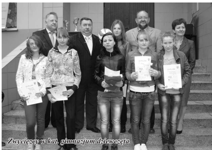
Zwycięzcy w kat. gimnazjum dziewczęta