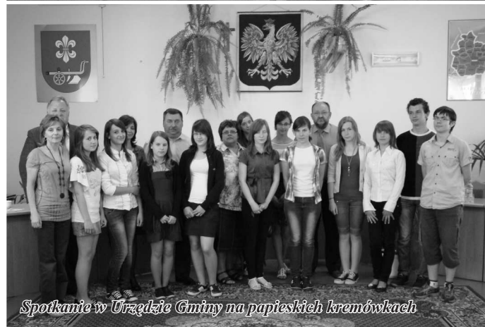
Spotkanie w Urzędzie Gminy na papieskich kremówkach