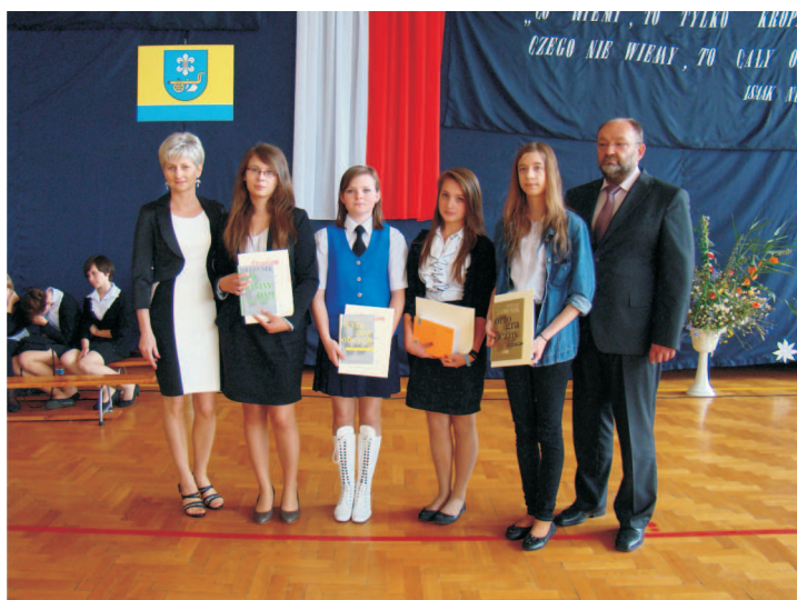
Laureaci Konkursu Literackiego