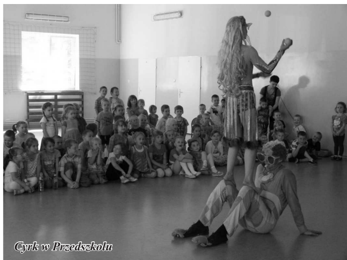
Cyrk w Przedszkolu

W maju do Przedszkola w Gozdowie zawitali artyści cyrkowi. Ubrani w barwne stroje prezentowali wspaniałe i zabawne sztuczki. Cyrk dostarczył maluchom ogromnej radości, wielu wrażeń i uśmiechów na twarzach.