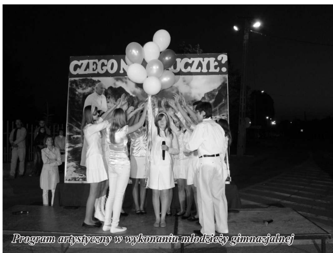
Program artystyczny w wykonaniu młodzieży gimnazjalnej

Wypuścili do nieba białe, żółte i niebieskie balony, które tego majowego wieczoru miały być pomostem łączącym dwa światy.