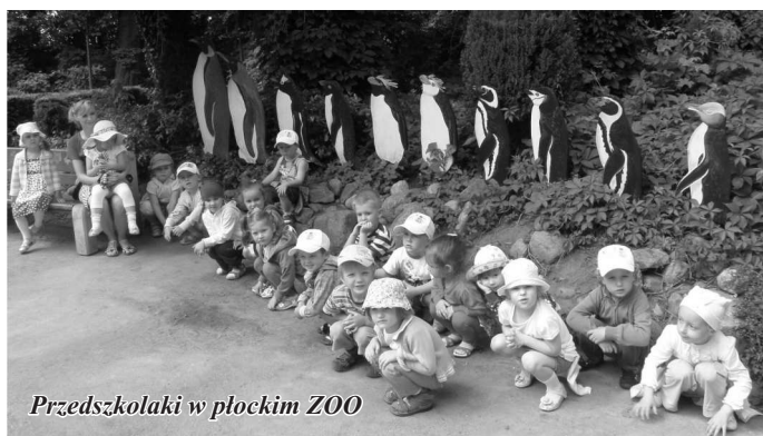
Przedszkolaki w płockim ZOO

We wtorek, 19 czerwca 2012r., dzieci wraz ze swoimi paniami wyruszyły na wycieczkę do płockiego ZOO. Zwiedzając piękny Ogród Zoologiczny nasze przedszkolaki zapoznały się z wieloma gatunkami zwierząt pochodzących z różnych stref klimatycznych świata. Wycieczka do ZOO była kolejną ciekawą przygodą dla naszych maluchów. Zmęczeni, ale pełni wrażeń i przeżyć, wróciliśmy do naszego przedszkola na pyszny obiad. Wyprawa naprawdę się udała!!