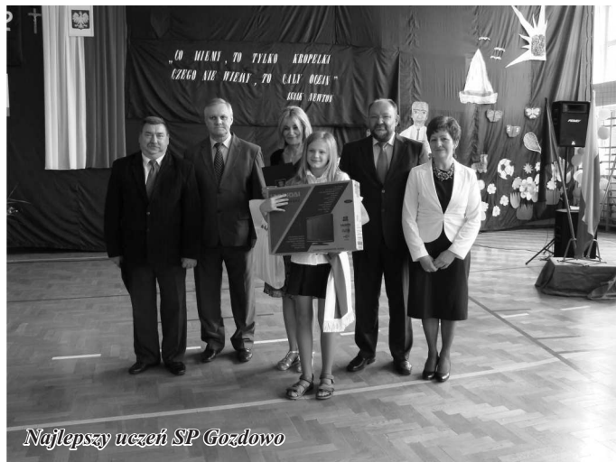
Najlepszy uczeń SP Gozdowo